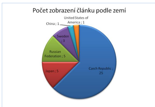
Obrázek 2 Počet zobrazení článku podle zemí

Repozitář DSpace nabízí statistiky přístupů: počet zobrazení záznamu a počet stažení souboru. Následující grafy ukazují počet zobrazení článku podle zemí a počet zobrazení článku podle data.