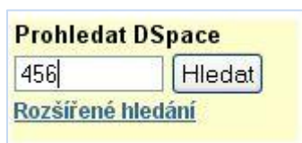
Obrázek 1 Zadání čísla pracoviště

V repozitáři DSPACE VŠB-TUO ( dspace.vsb.cz ), v kolekci Publikační činnost VŠB-TUO si vyhledejte podle svého jména články. Kolekce obsahuje záznamy článků z časopisů indexovaných v bibliografické databázi Web of Science. Články lze vyhledat také v kolekcích jednotlivých pracovišť. Do vyhledávacího pole stačí zadat číslo pracoviště. (viz Obrázek 1)