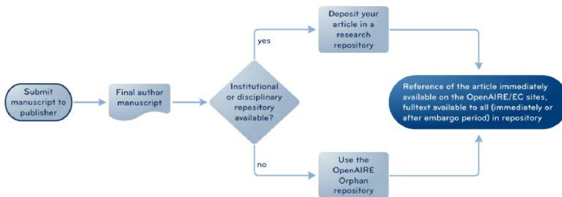
Obrázek 3 Kroky pro splnění politiky otevřeného přístupu EK